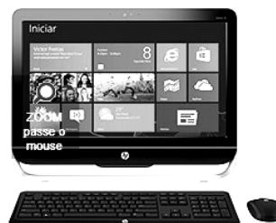
Computador HP All in One 23-b010br com Intel Core i3 4GB 1TB LED 23" Windows 8

A citação “4GB” faz referência ao seguinte tipo de memória: